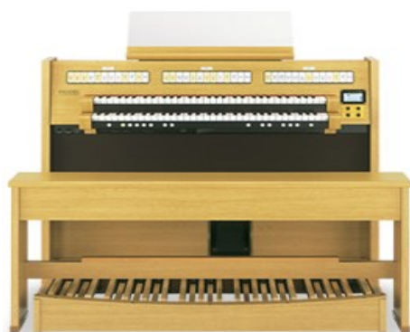
(使用楽器: Roland C-330)